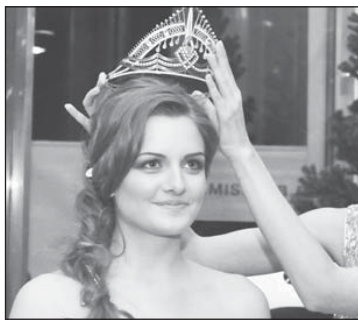
В момент коронации