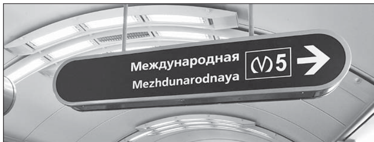
Для петербуржцев новые станции - настоящий подарок

Впрочем, главное, чтобы станции радовали не только красотой, но и бесперебой-