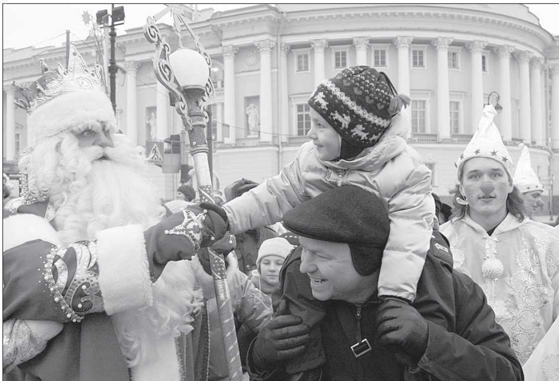
За весельем - в центр Петербурга