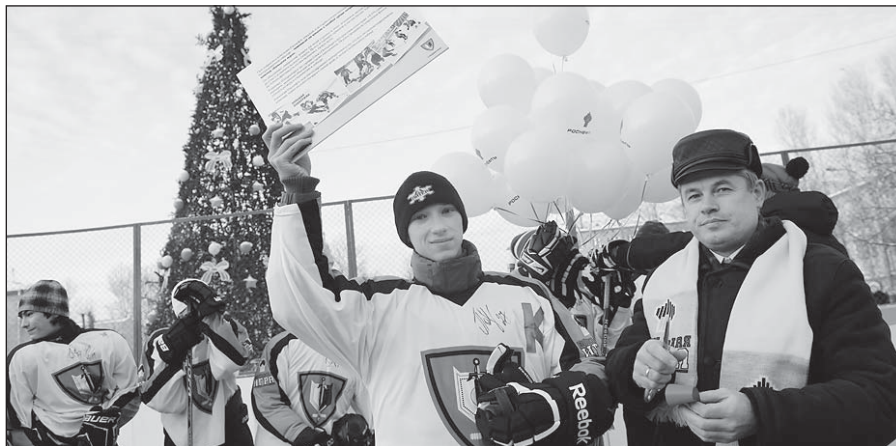
«Гладиаторы» выиграли приз в упорнейшей борьбе

Этот турнир, носящий знаковое название «Большая игра», - уни-