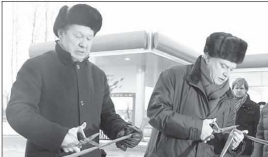
Алексей Миллер и Георгий Полтавченко торжественно разрезают ленточку на открытии нового МАЗК

Алексей Миллер отметил, что такой переход позволит существенно экономить на расходах. Так, в пересчете расходы на га-