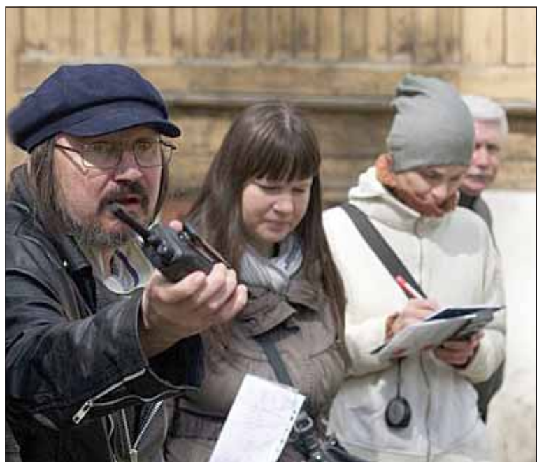
Алексей Балабанов снял самый светлый фильм в своей творческой биографии