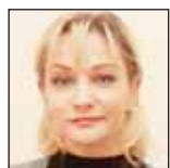
Татьяна БУЛАНОВА, певица:

- Больше двадцати лет назад нас привезли на съемки для телепередачи в загородный дом одного известного диктора. По тогдашним меркам это был невероятный дом: огромный, удобный, идеально вписанный в пейзаж. Тогда небывалое впечатление на меня произвело то, что и снаружи, и внутри были использованы мрамор, гранит и благородные породы дерева. Теперь все чаще