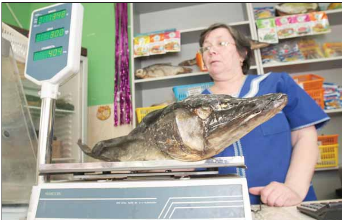
Ладожская рыбка расходуется на ура!