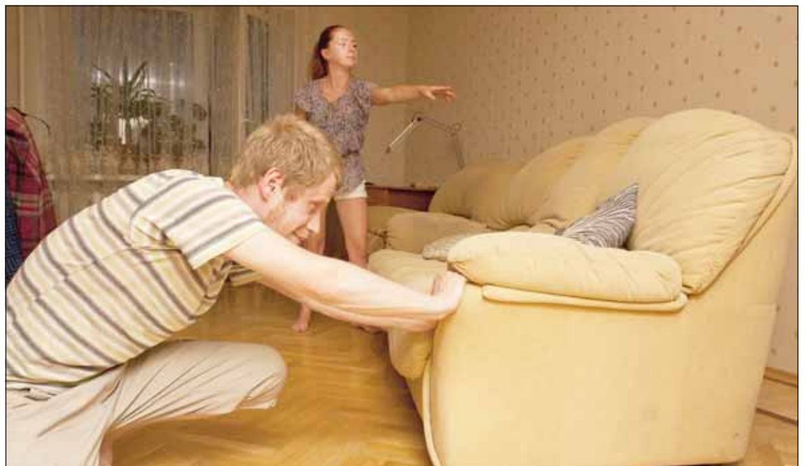
Не втискивайте огромный диван в маленькую комнату - он станет хозяином вместо вас

ОТКАЗАВШИСЬ от композиций из пластиковых цветов, букетов и «невероятной» красоты композиций, можно не только показать, что ваш дом живет в ногу со временем, а не застрял в восьмидесятых, но и избавиться от огромного количества пыли. Кстати, не меньшим захламляющим фактором являются непомерно раздувшиеся коллекции всяких игрушек и безделушек. Семь слоников на счастье - вполне достаточное количество, выставленное напоказ. Остальных слоников лучше держать где-нибудь в шкафу.