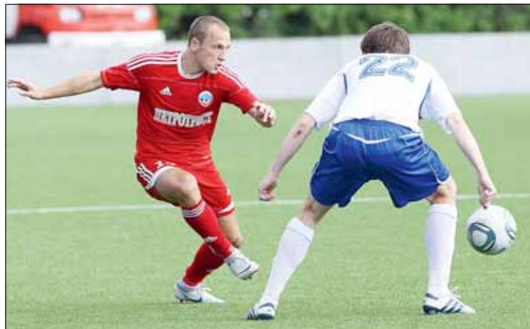
«Петротресту» в нынешнем сезоне придется непросто

КАК И ОЖИДАЛОСЬ, первый блин во втором по значимости дивизионе российского футбола - первенстве ФНЛ - вышел для питерского «Петротреста» комом. Выходцы из второго дивизиона в стартовом матче сезона были разгромлены на выезде екатеринбургским «Уралом». Но ставить на команду крест, конечно же, преждевременно - задача по сохранению прописки в ФНЛ сложна, но выполнима.