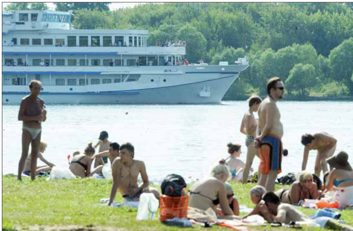
Кому не по карману корабль, смотрит на него со стороны

По мнению большинства экспертов, главная причина лежит на поверхности. Общество до сих пор не отошло от прошлогодней трагедии теплохода «Булгария». К тому же средства массовой информации не перестают о ней напоминать. И не важно, что то ЧП произошло далеко от невских вод и отдельно взятый случай не может характеризовать всю отрасль в целом. Так уж устроены люди. После любой подобной трагедии психологически тяжело сесть. В данном случае на теплоход. К тому же периодически с разными судами что-