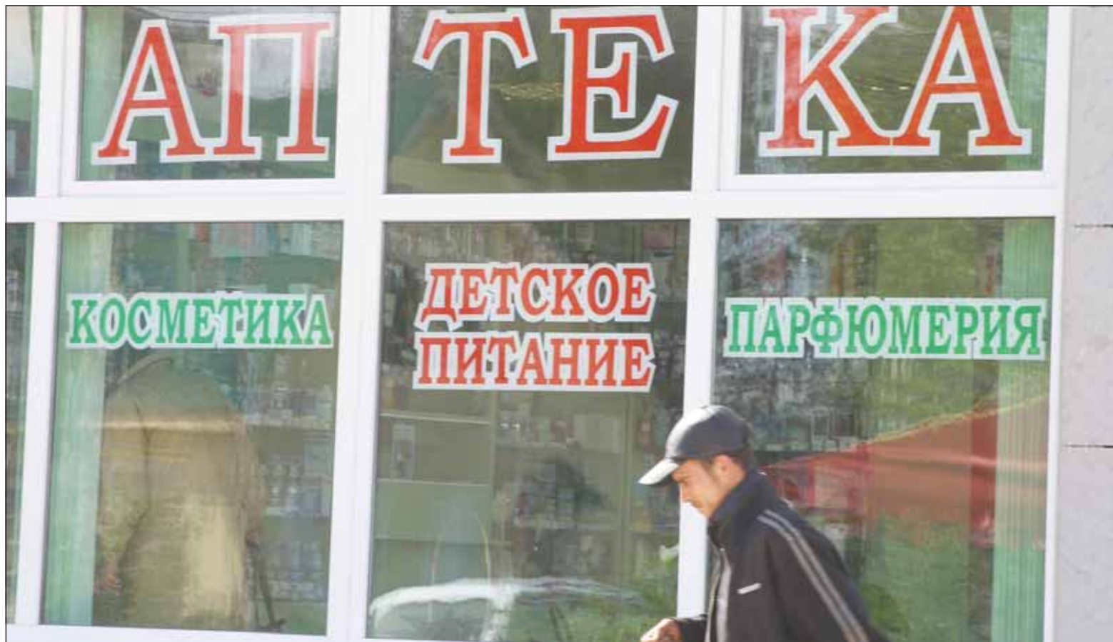
В некоторых аптеках можно найти все, что угодно, кроме нужных лекарств

- Есть много причин, по которым вымывается сегмент дешевых лекарственных