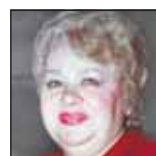
Наталья КРАЧКОВСКАЯ, актриса:

встречаются дома куда роскошнее и наряднее, но тот дом навсегда запал мне в память: я впервые увидела сооружение, построенное и оформленное для человека, а не для коллектива, дом, в котором отдыхать на самом деле удобно, а дышать - вольно.