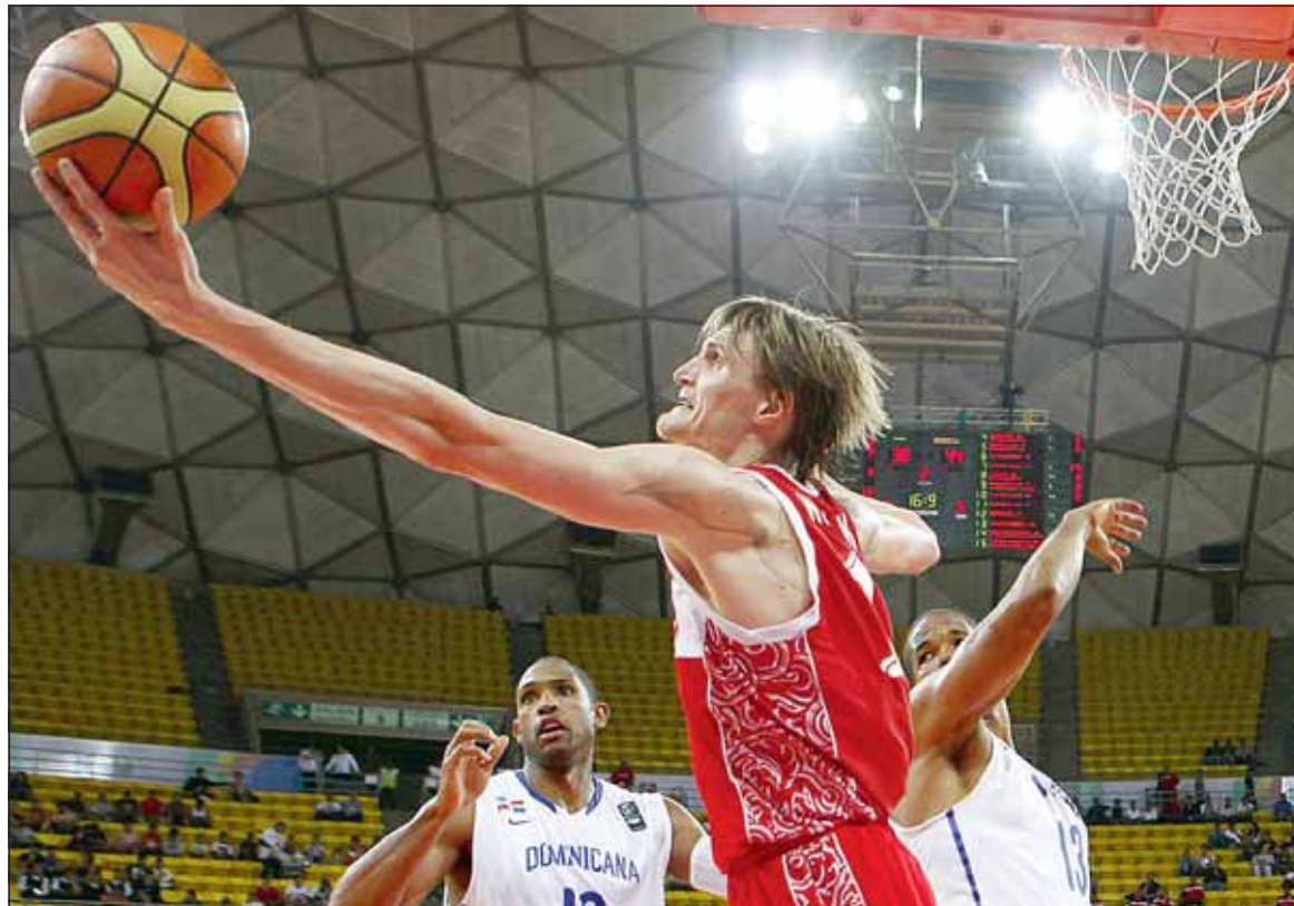
Андрей Кириленко подходит к Играм в Лондоне в прекрасной форме

Тогда казалось, что успех на Евробаскете-2007 был счастливым случайностью и сборную Россию ждет очень