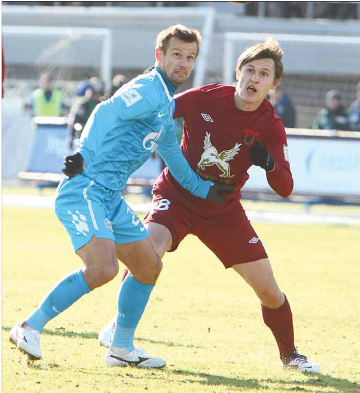
Сергей Семак в чемпионате России сыграл лучше

Пусть игроки «Зенита» накануне Суперкубка почти в один голос говорили о важности победы, шансы на победу изначально отнюдь не выглядели стопроцентными. Да, по классу питерцы превосходят казанцев, но даже самая мощная команда после двух месяцев без игровой практики не может «с листа» выдать чудо-футбол. Особенно на жаре, а столбик термометра в Самаре, где и проходил матч, зашкаливал за +30. Серьезной пробоиной в составе стало отсутствие одного из ключевых игроков команды Александра Анюкова, подхватившего ангину. Очень обидно для Анюкова, ведь 29-летний защитник родился и вырос в Самаре, провел несколько сезонов за «Крылья Советов».