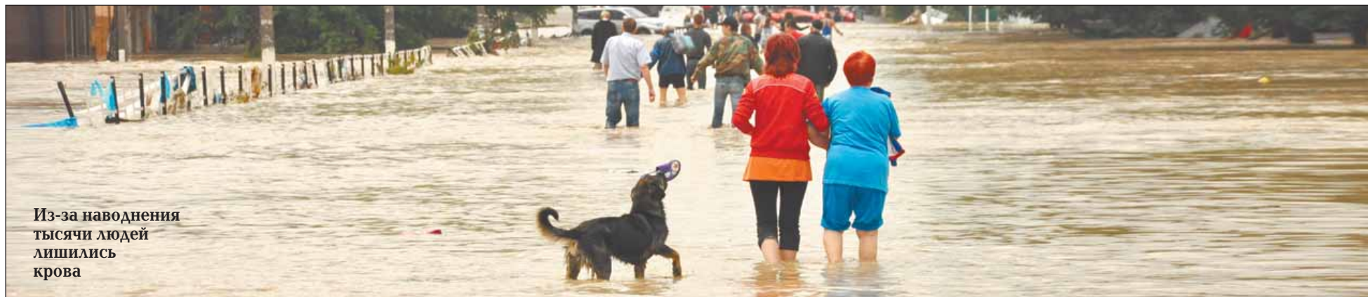
Из-за наводнения тысячи людей лишились крова