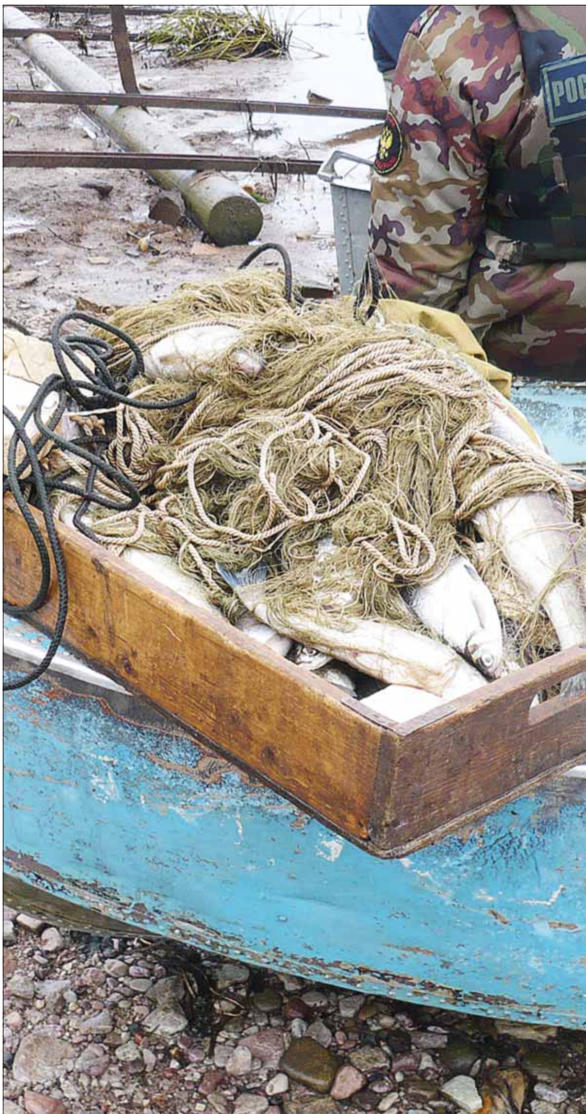
Инспекторы изымают у браконьеров от нескольких килограммов до тонны незаконно выловленной рыбы

- Бывало, в день фиксировали по 10 нарушений, уголовных дел за полгода завели семь штук (это в тех случаях, когда ущерб был особенно большой), - рассказывает он. - Вот на реке Паше нашлись умельцы - они с помощью двух лодок перегородили всю реку сеткой и ловили таким варварским способом ладожского лосося, занесенного в