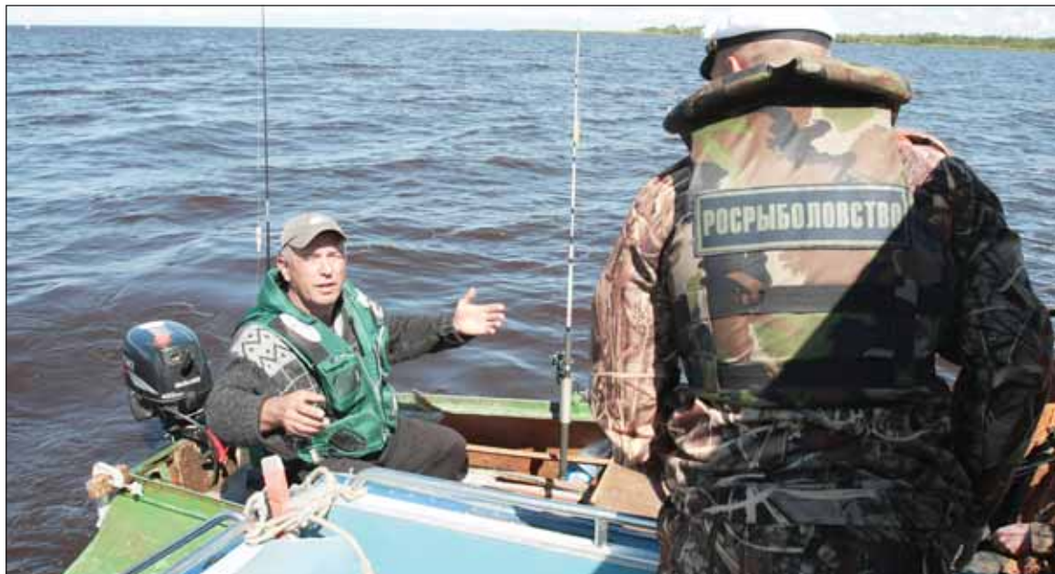
«Как это нельзя забрасывать больше двух удочек?! В первый раз слышу!»

- Меня очень возмущают браконьеры, которые своими действиями просто уничтожают популяцию рыбы! Я сейчас на пенсии, время есть, и в меру сил стараюсь помогать инспекторам, - пояснил он. - Но у нас население ушло с воды, а потом вызвать инспекторов, как в третий раз браконьеры уже узнают лодку. Поэтому за последний нерест мне пришлось трижды ее перекрашивать!