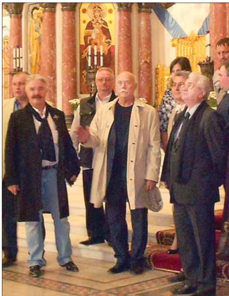
Президент проекта Михаил Пиотровский и куратор проекта Станислав Говорухин в Кронштадтском морском соборе