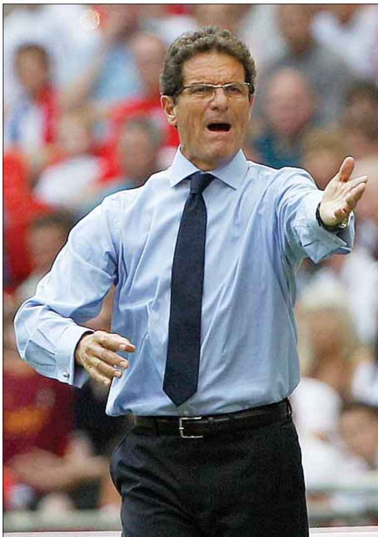
Капелло тоже хочет определенности